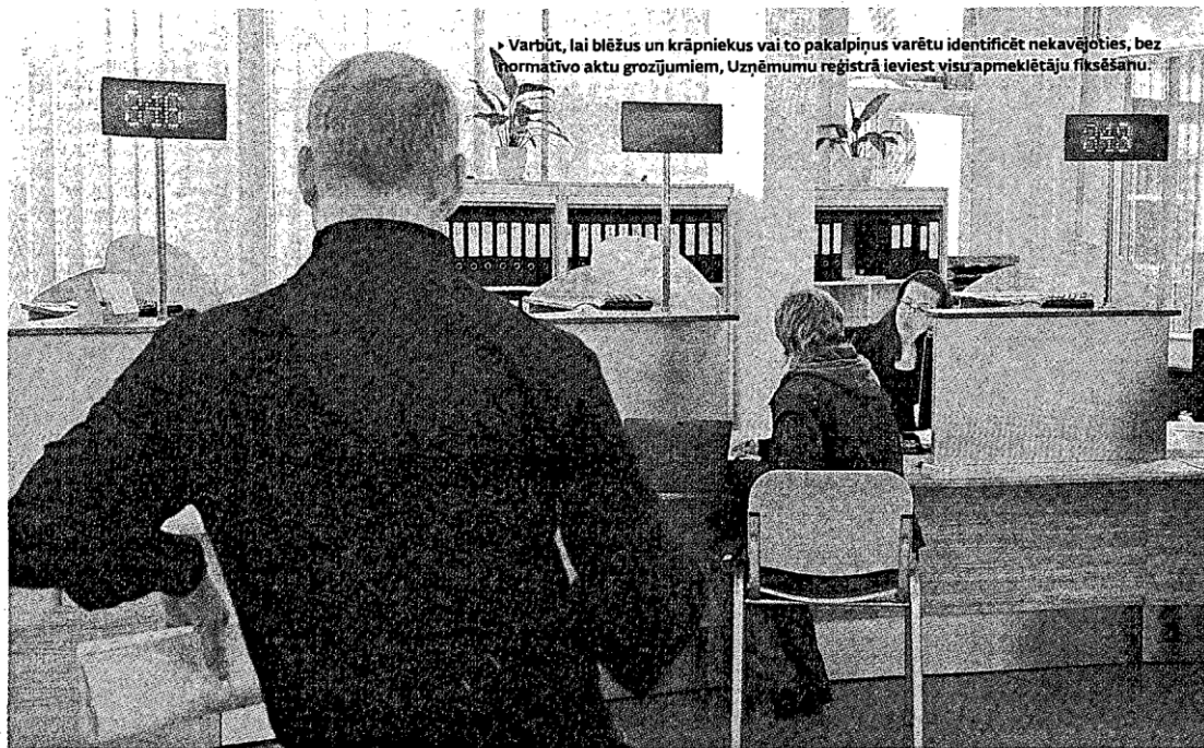
Varbūt, lai blēžus un krāpniekus vai to pakalpiņus varētu identificēt nekavējoties, bez normatīvo aktu grozījumiem, Uzņēmumu reģistrācijā ieviestu visu apmeklētāju fiksēšanu.

Fiktīvo uzņēmumu reģistrācijas, reiderisma, viltotu dokumentu un parakstu viltošanas iespēju mazināšanai bez juridiskiem šķēršļiem varot tikt piedāvāta dokumentu iesniedzēju fiksēšana