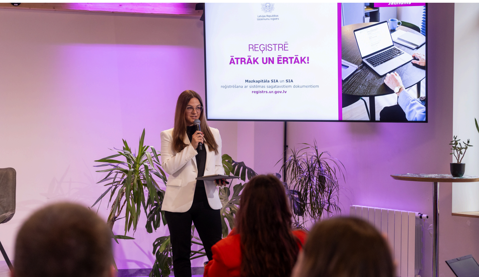
Foto UR galvenā valsts notāre Laima Letiņa pakalpojuma prezentācijas pasākumā 2025. gada 18. jūnijā

Šie pakalpojumi ir piemērota izvēle gadījumos, kad viena fiziska persona ir dibinātājs, valdes loceklis un patiesais labuma guvējs, kurš parakstīs visus dibināšanas dokumentus.