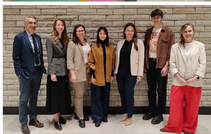
Valsts kancelejas Inovācijas laboratorija.